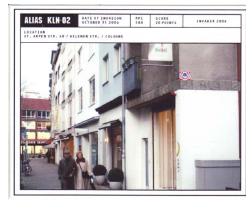
ALIAS KLN-02, 2006 180 Keramik-Kacheln/Gießharz 26 x 34 x 4 cm